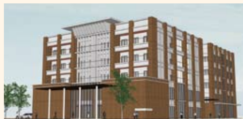
新校舎完成予想図

本学では平成22年10月着工・24年度より供用開始の予定で、新校舎の建設を計画しています。